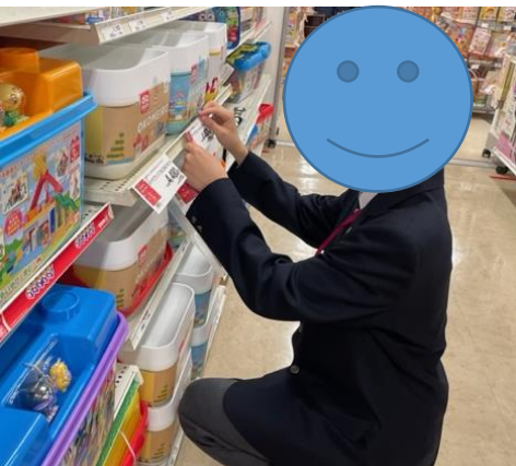
お客様にわかりやすいように…