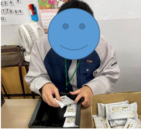
向きに気を付けながら…

高等部1・2年生が11月18日(月)~29日(金)の日程で後期現場実習・校内実習に臨みました。様々な企業や事業所に御協力をいただき、校内外で今後の進路に向けた貴重な経験を得ることができました。