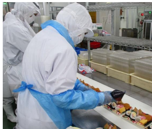
落ち着いて、根気強く…