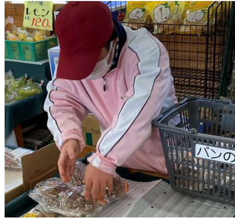
心を込めて、丁寧に…