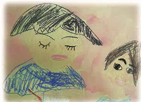
本校A部門小学部 児童作品「私と先生」