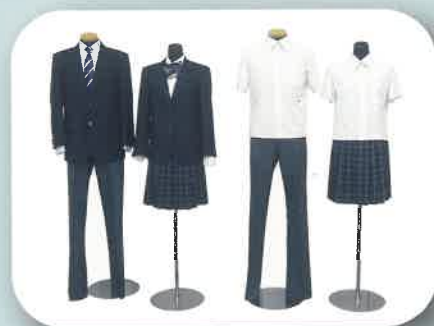
本校中学部・高等部 制服