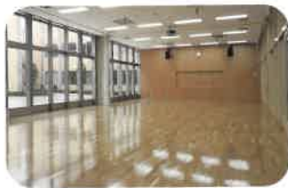
多くの人が集いやすい 昇降口前の交流ホール