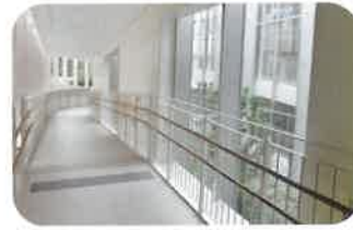
開放的な屋内スロープ