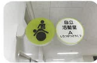
シンボルを取り入れた 分かりやすい教室表示プレート