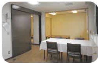
お風呂やキッチン等が 備わった生活体験室