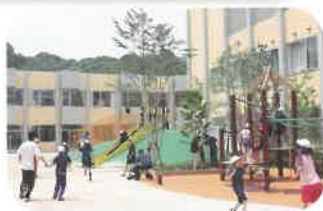
児童生徒が集う遊び場 (冒険の庭)